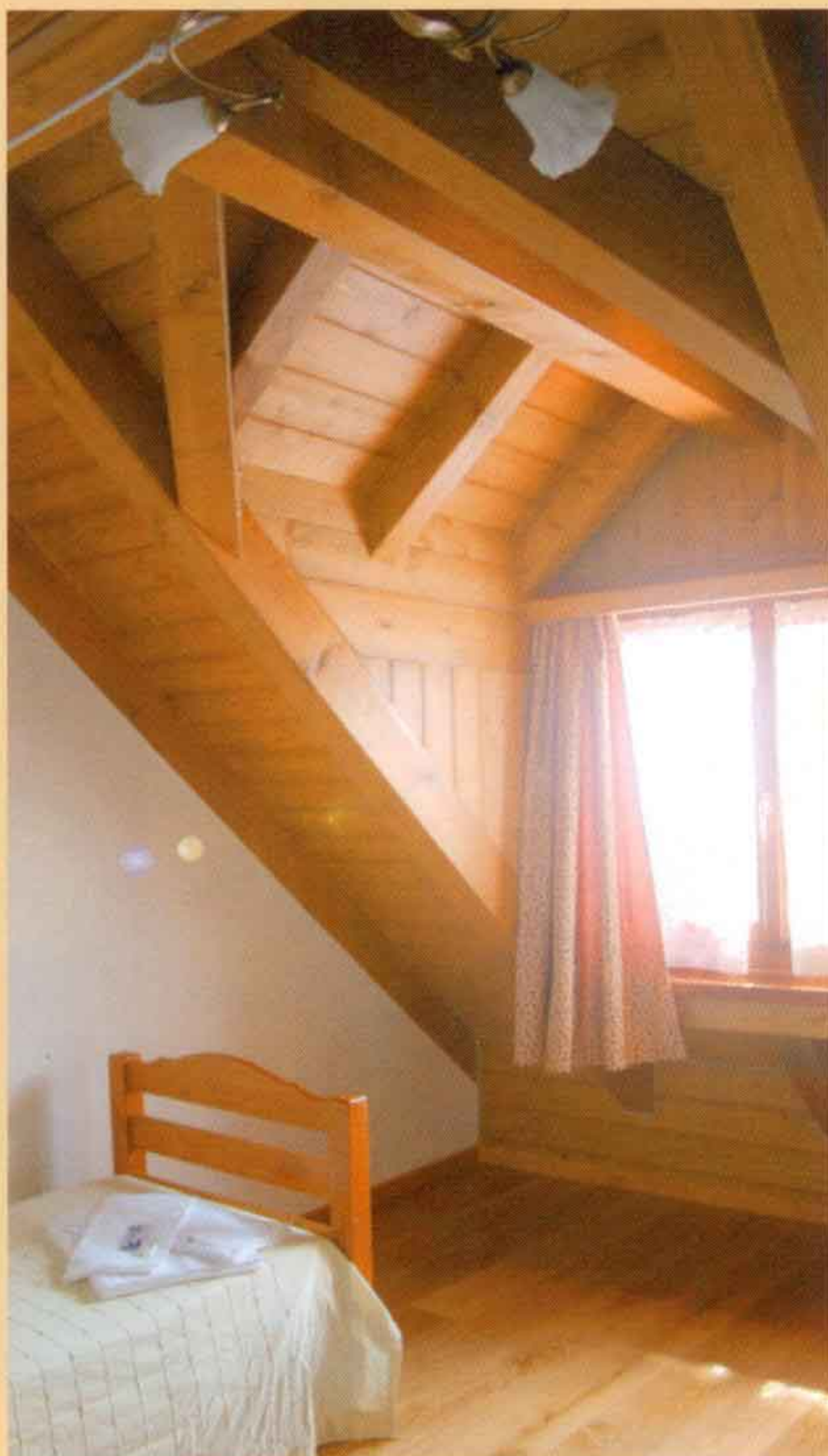
interno alloggio La Questarie

“La cultura dell'ospitalità va rivitalizzata. I presupposti di base ci sono, l'azione degli enti pubblici dovrebbe essere volta a sviluppare sul territorio iniziative che coinvolgano le realtà del luogo in progetti comuni e condivisi”.