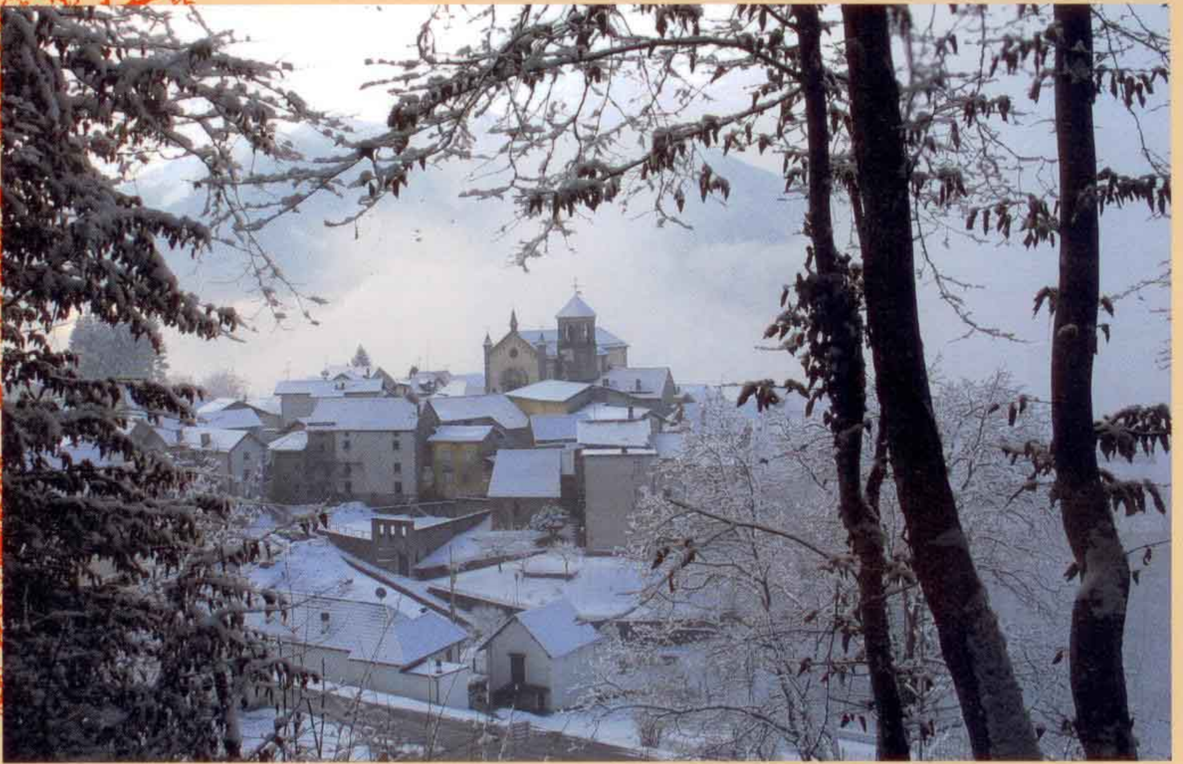
panoramica invernale Avaglio Trava

"La di Ferigo" Facciata e interno dell'alloggio localizzato nella frazione di Trava. Si tratta di una tipica architettura Carnica di fine settecento completamente ristrutturata con un uso sapiente della pietra, del legno e del cotto. Ampi spazi verdi con giardino per i giochi dei bambini e per i pranzi e le cene all'aperto. Parcheggio e pineta.