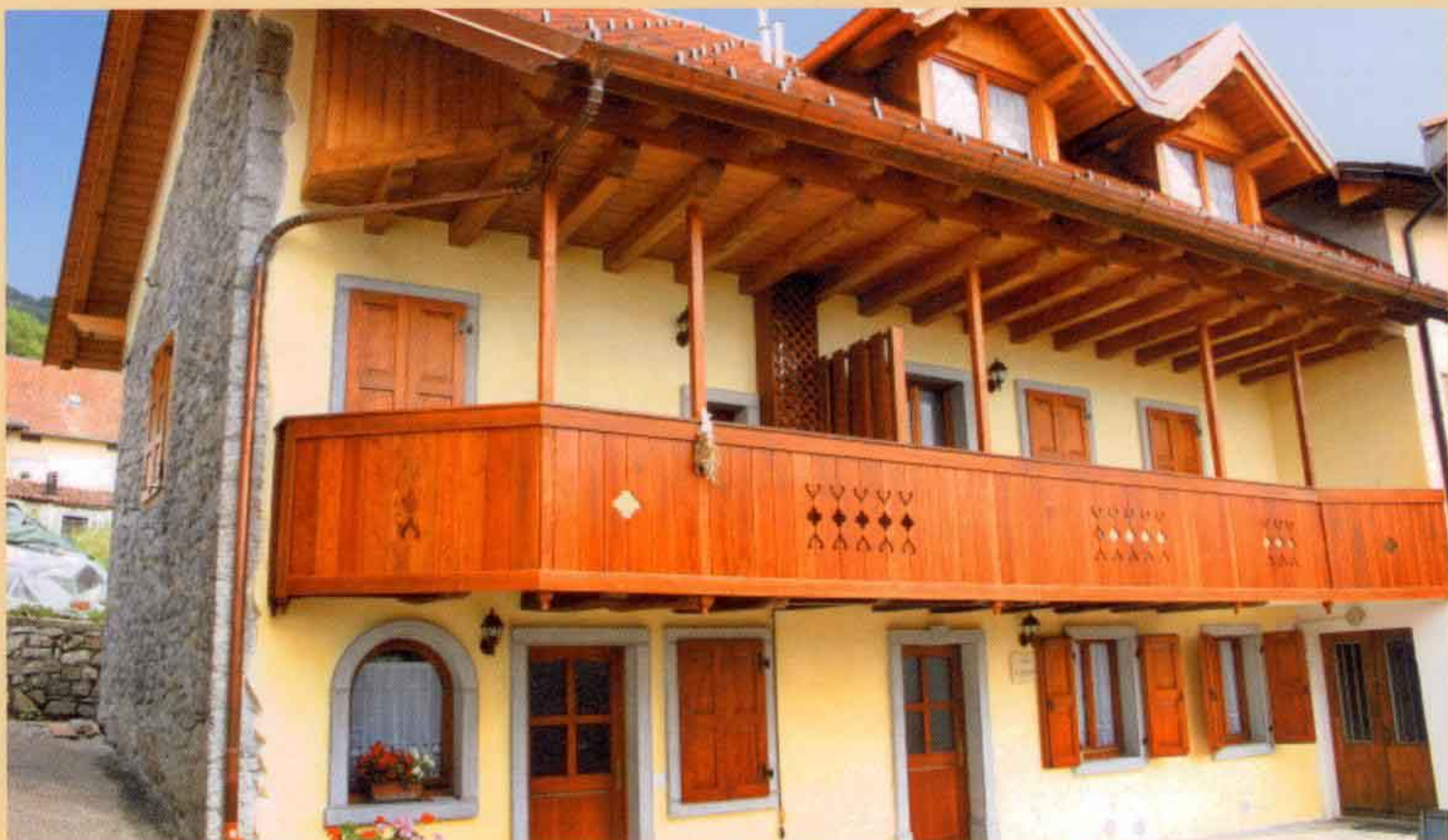
Facciata dell'alloggio "La Questarie" localizzato nella frazione di Avaglio. L'abitazione si trova a 200 metri dalla piazza principale ed è composta da due appartamenti autonomi con annessa terrazza.

Albergo diffuso punta a sviluppare il turismo montano attraverso una proposta alternativa. Che cosa si può fare ancora in questa direzione?